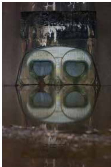
Olivier Panier des Touches