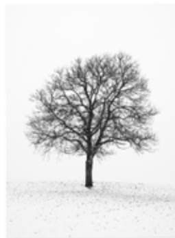
PORTRAIT D'ARBRE, ÉTUDE NO. 1 Platin-Palladium Abzug auf Arches Platine, 2016

AUSSTELLUNG 6. NOVEMBER BIS 27. NOVEMBER