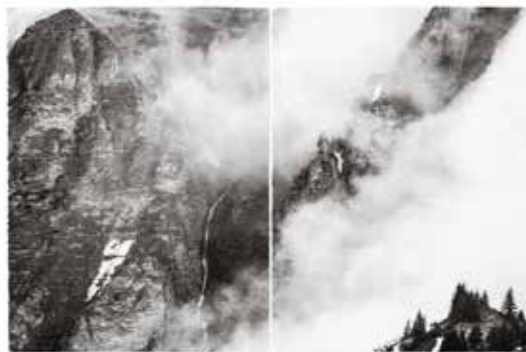
LAND OF THE GODS (Diptychon) Platin-Palladium Abzug auf Arches Platine, 2018