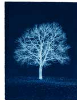
PORTRAIT D'ARBRE, PRUSSIAN BLUE STUDY NO.1 Cyanotypie auf Arches Platine, 2016