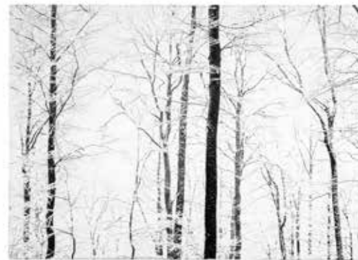
STANDING TOGETHER Platin-Palladium Abzug auf Arches Platine, 2018