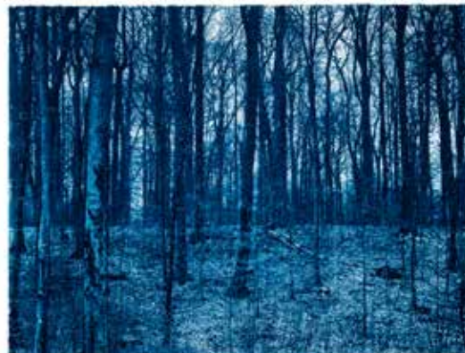
PRUSSIAN BLUE FOREST Cyanotypie auf Arches Platine, 2018